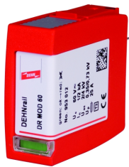
Оригинал может отличаться от изображения