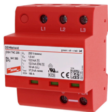
Оригинал может отличаться от изображения