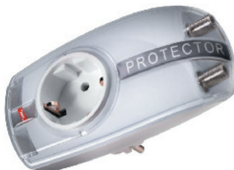
Рис. 2. Комбинированный адаптер (модель DPRO 230 TV, производства компании Dehn+Söhne)

Стойка антенны и ее рабочие элементы должны быть заземлены, иначе ток молнии целиком пойдет через коаксиальный антенный кабель, совершенно не предназначенный для такой цели. Токоотвод и главная заземляющая шина должны быть рассчитаны на полный ток молнии (16, 25 и 50 мм 2 для меди, алюминия и стали соответственно), потому что другого пути для его транспортировки нет. К сожалению, и при тщательно выполненном заземлении антенны часть тока молнии все равно ответвится в антенный кабель и через него может добраться до телевизора или до антенного усилителя, если он